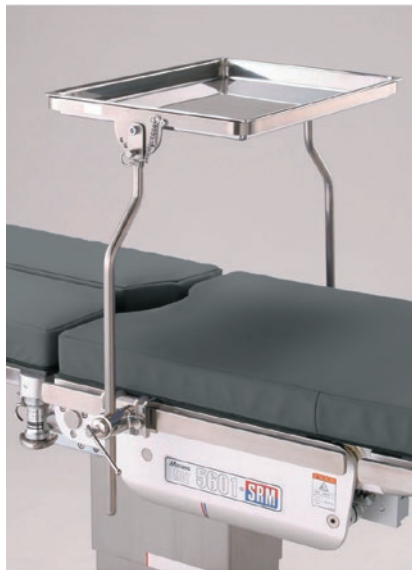
消毒盤寸法 : W350×D500(mm)