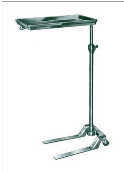
消毒盤寸法: W350×D500 (mm) 昇降範囲: 940~1370 (mm)