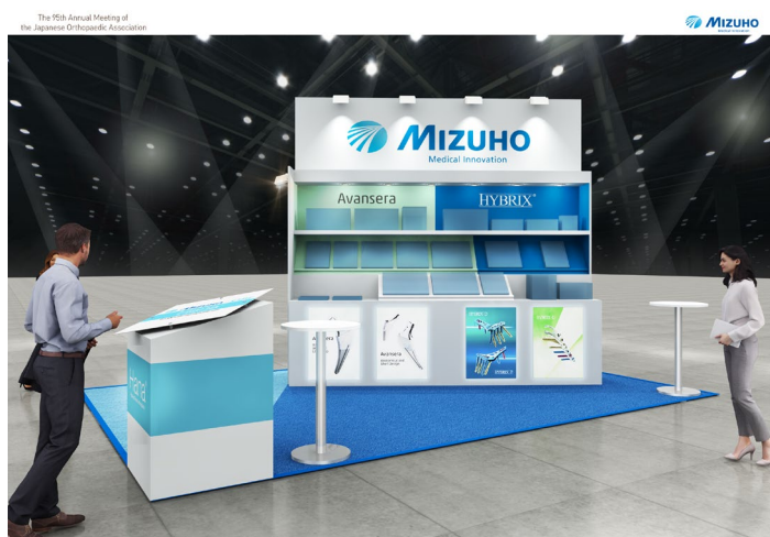
15th - The 95th Annual Meeting of the Japanese Orthopaedic Association / Date / May 19 (Thu) - 22 (Sun), 2022 / Venue / KOBEX Convention Center IMAGE SHOT