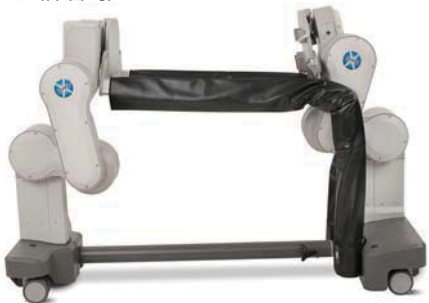
80 inches in stored position