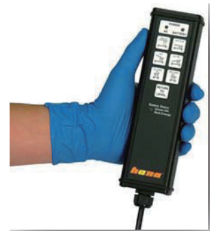
電動ハンドペンダント