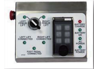
本体コントロールパネル